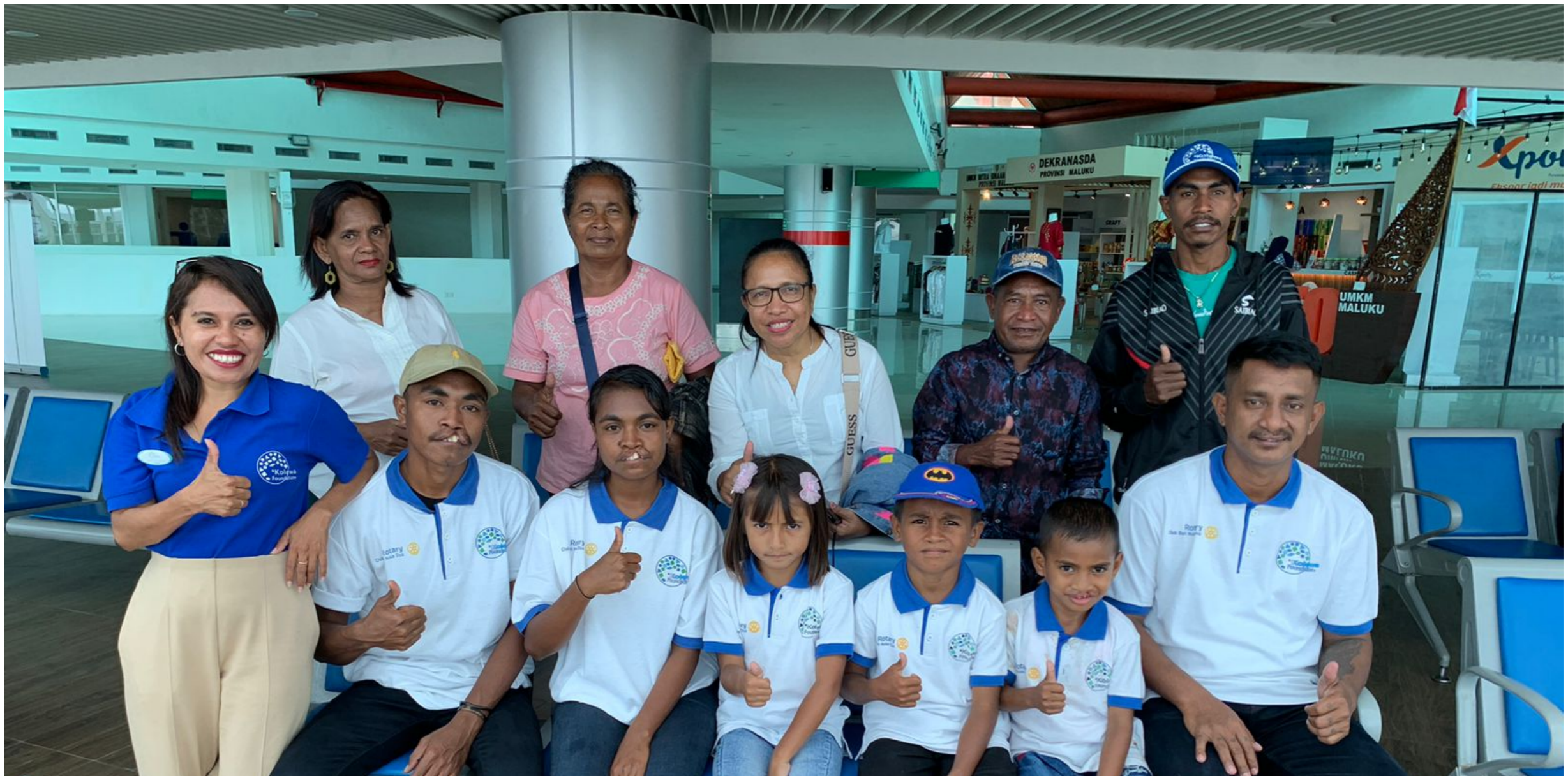
Vanaf het moment dat de auto tot beschikking kwam werd hij dagelijks ingezet, met name vanuit de Molukken arriveerden een aantal grote groepen voor een operatie.

Al snel werd duidelijk dat we het aantal ritten niet afkonden met het inzetten van leden van ons bestaande team. We besloten Wayan, die we overigens al jaren goed kennen als partner van Ana, aan te