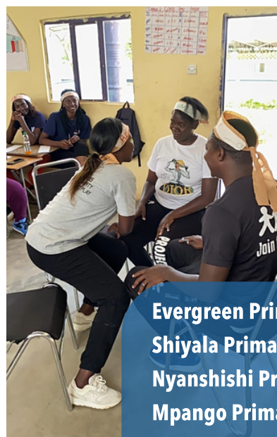
Evergreen Primary School Shiyala Primary School Nyanshishi Primary School Mpango Primary School Chinkuli Primary School Bunda Bunda Primary School