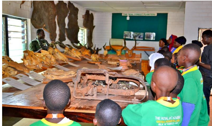
Huiden, schedels en meer

Klein maar fijn. Ze hebben een museum met overblijfsels van de dieren uit het park.