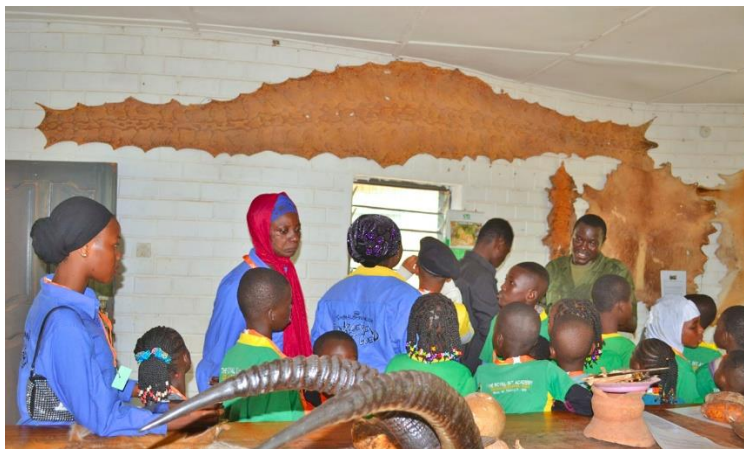
Grote python huid aan de muur