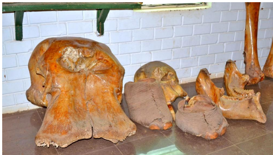
Olifanten schedel, kaak, en voeten