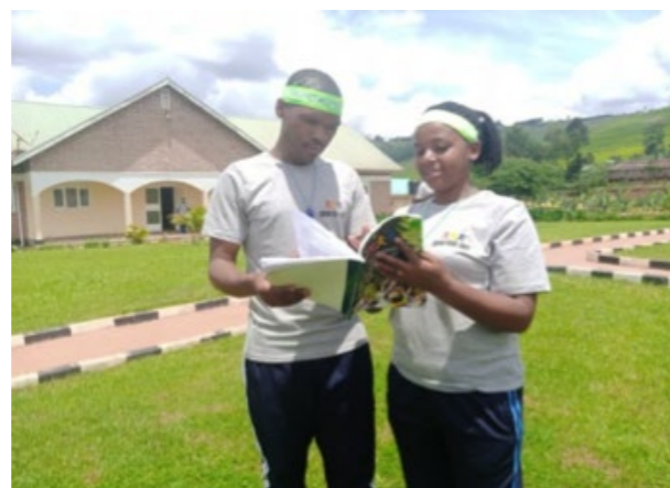
Leraren bereiden zich voor op een activiteit.