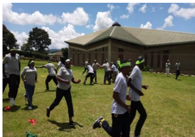
Leraren spelen het spel 'Bad Habit Run'.

Eén spel wat bijvoorbeeld gespeeld wordt om te praten over slechte gewoontes is "The Bad Habit Run". Het doel van dit spel is om kinderen bewust te maken van negatieve invloeden en slechte gewoontes. Eén kind (de tikker) staat in het midden van het veld, de rest van de groep staat aan de zijlijn. De zijlijn is de 'healthy free zone'. Wanneer de tikker in het midden een "bad habit" roept, rennen alle kinderen naar de overkant van het veld. Zij proberen veilig in de andere 'healthy free zone' te komen. Wordt je getikt dan help je de 'bad habit' tikker. Tijdens en na het spel wordt er met de groep besproken wanneer en of zij wel is in aanraking zijn gekomen met deze 'bad habits' en hoe zij dit in de toekomst kunnen voorkomen.